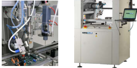
倾斜和旋转涂覆阀

两种设备型号都采用强固的3轴运动平台，基本配置已包括涂覆阀和顶针阀。也可改用定容控制阀以代替顶针阀。