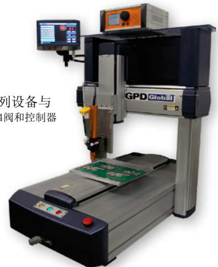
Island 3S4系列设备与 GPD Global® PCD4阀和控制器

不管是复杂或简单的点胶应用，Island系列点胶机的精度及可靠性可确保任务完美的达成。高规格材料的使用确保机台坚固耐用，并可轻松应付其他应用或搭配其他点胶阀。